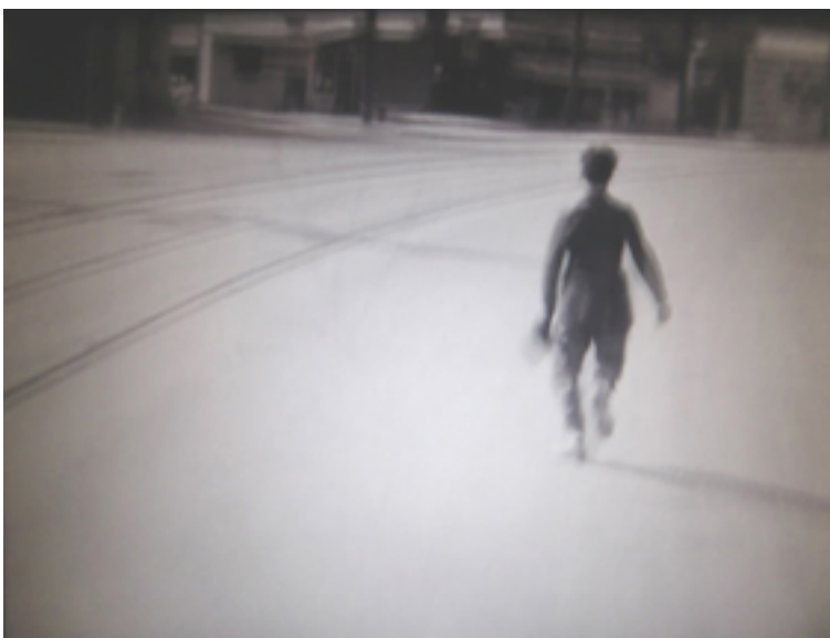
Charles Chaplin, A Film Johnnie , Keystone 1914

Variety, New York, 14. Mai 1915: “Zu den Pictures im Programm gehörte auch ein Chaplin Film, der Caught in the Rain hiess und der Zensur nur knapp entging (das National Censor Board billigte ihn, was viel bedeuten mag oder nicht).”