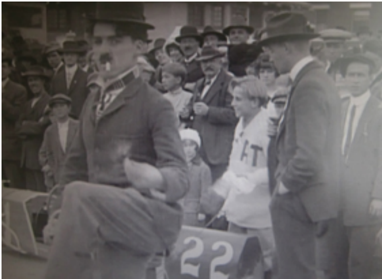
Charles Chaplin, Kid Auto Races at Venice, Cal. , Keystone 1914