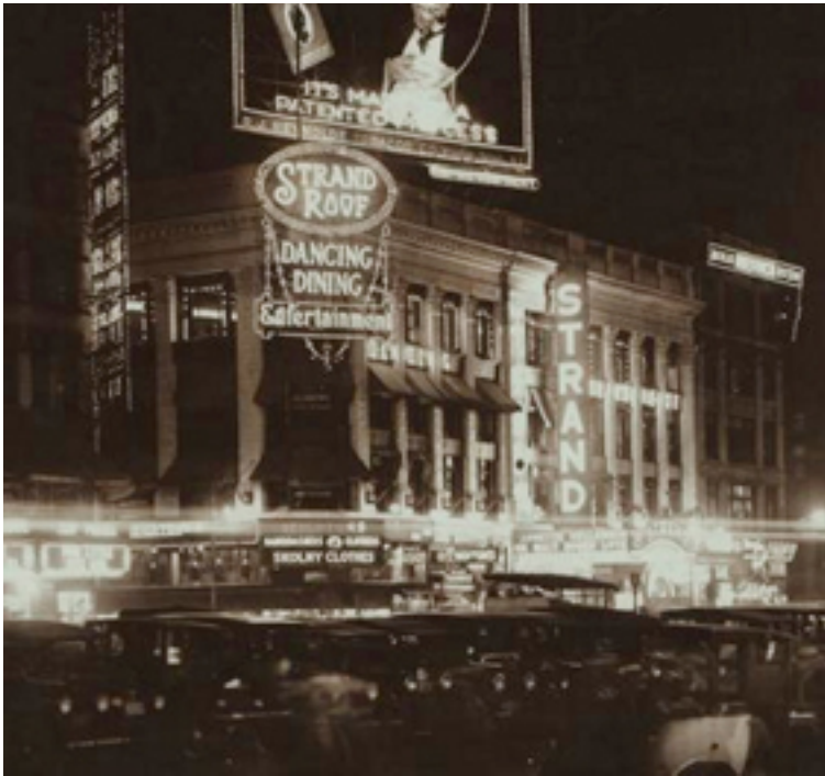
Eröffnet 11. April 1914: Strand, Broadway/47th Street, New York