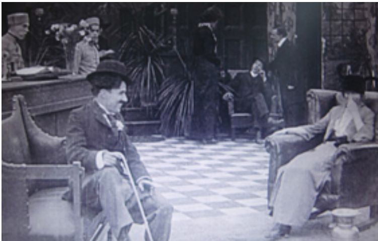
Charles Chaplin, Mabel's Strange Predicament , Keystone 1914